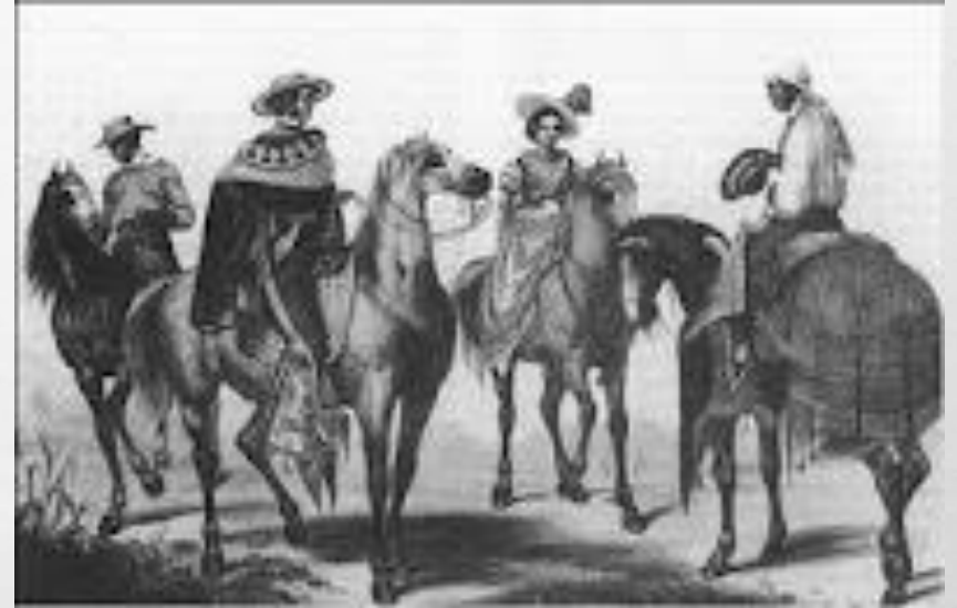
FAMILIA LONDOÑO MIGRANDO HACIA EL SUR